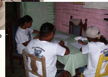
Miembros de FLAMUR procesando firmas dentro de Cuba